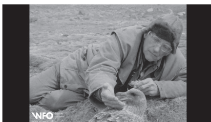
Kadr z filmu „Niewyraźny klekot ptaków”