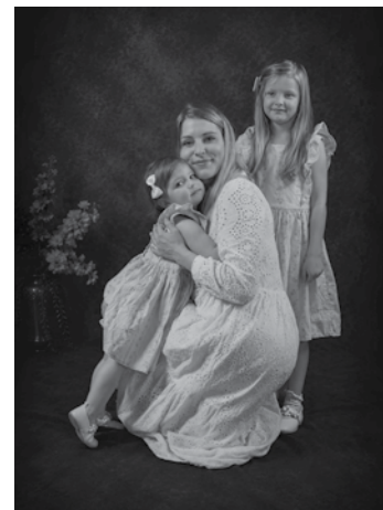
Akcja fotograficzna z okazji Dnia Matki w Pałacu Czeczów pokazała, jak dużym zainteresowaniem cieszą się inicjatywy Kojzkiego Klubu Fotograficznego. Teraz przed mieszkańcami kolejne wyzwanie – wakacyjne warsztaty „KOZA 2026”.

Teraz przyszedł czas na kolejny krok. Warsztaty „KOZA 2026” skierowane są do młodzieży i dorosłych od 16. roku życia. W programie znalazły się zajęcia poświęcone kompozycji, pracy z aparatem, świadomemu budowaniu obrazu oraz rozwijaniu fotograficznej wrażliwości. Uczestnicy wezmą udział w plenerach, otrzymają indywidualne zadania, a zwieńczeniem całego projektu będzie wystawa prezentująca najlepsze fotografie. Zajęcia organizowane przez Kojzki Klub Fotograficzny przy wsparciu Domu Kultury w Kozach będą odbywać się przez całe wakacje. Udział jest bezpłatny, jednak liczba miejsc została ograniczona – szczegóły znaleźć można na plakatach, uzyskać je można również drogą mailową: kadryzwydarzen@gmail.com lub telefoniczną: 796-704-023. (RED)