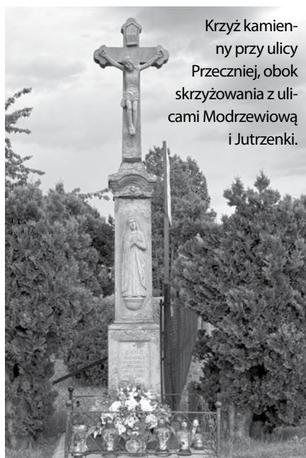
Krzyż kamien-ny przy ulicy Przeczniej, obok skrzyżowania z ulicami Modrzewiową i Jutrzenki.