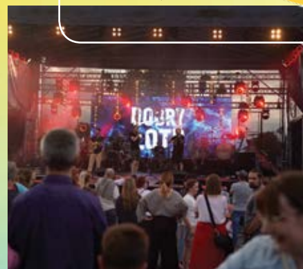
Wieczne koncerty przyciągnęły tłumy mieszkańców i gości. Publiczność wspólnie bawiła się podczas występów gwiazd tegorocznych Dni Kóz, tworząc wyjątkową atmosferę czerwcowego święta.